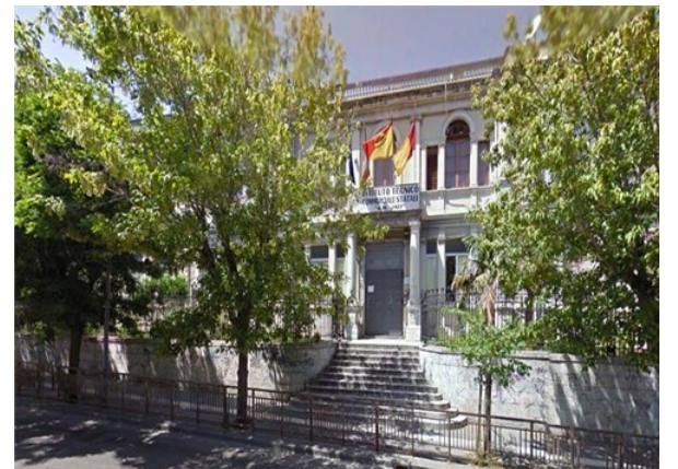
L'Istituto Tecnico Economico Statale "A. M. Jaci" Via Cesare Battisti 88 – 98122 Messina