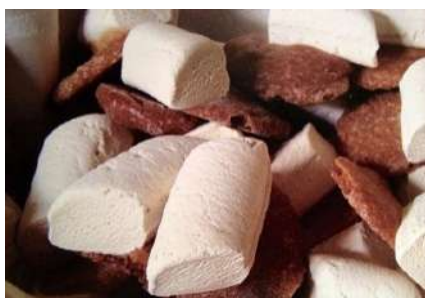
Questa foto di Autore sconosciuto è

La ricorrenza è preceduta da un tempo di preparazione e preghiera in suffragio dei defunti della durata di nove giorni: la cosiddetta novena dei morti, che incomincia il giorno 24 ottobre. Alla commemorazione dei defunti è connessa la possibilità di acquistare un'indulgenza, parziale o plenaria, secondo le indicazioni della Chiesa cattolica. In Italia, benché molti lo considerino come un giorno festivo, la commemorazione dei defunti non è mai stata ufficialmente istituita come festività civile.