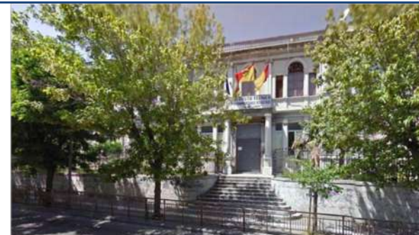
L'Istituto d'Istruzione Superiore "A. M. Jaci" Via Cesare Battisti 88 – 98122 Messina

Anticamente era uso ed oggi molto meno punire i monelli non facendo trovare alcun dono affinché servisse da lezione. Ci si chiede, perciò, perché omaggiare il 2 novembre. Prima di tutto per il rispetto dei nostri defunti, in secondo luogo, sebbene il sacro e il profano siano in questo caso un tutt'uno, è la memoria di chi abbiamo conosciuto che non va dimenticata; in terzo luogo la cultura ce lo ha insegnato Ugo Foscolo, padre dei Sepolcri. È lui che ha innestato in noi quella "corrispondenza d'amorosi sensi", quella pietà che ci rende fragili al cospetto di una tomba. E quale uomo può sentirsi tale se manca il desiderio "di andare a comunicare" con un fiore con il proprio caro?